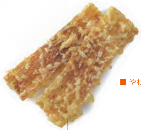
■ やわらか剣先いかフライ