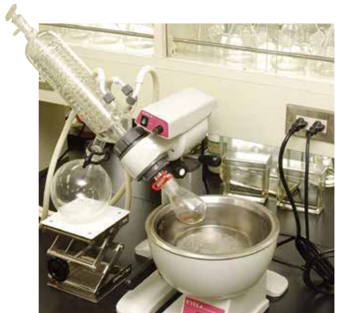
充実した検査機器による分析